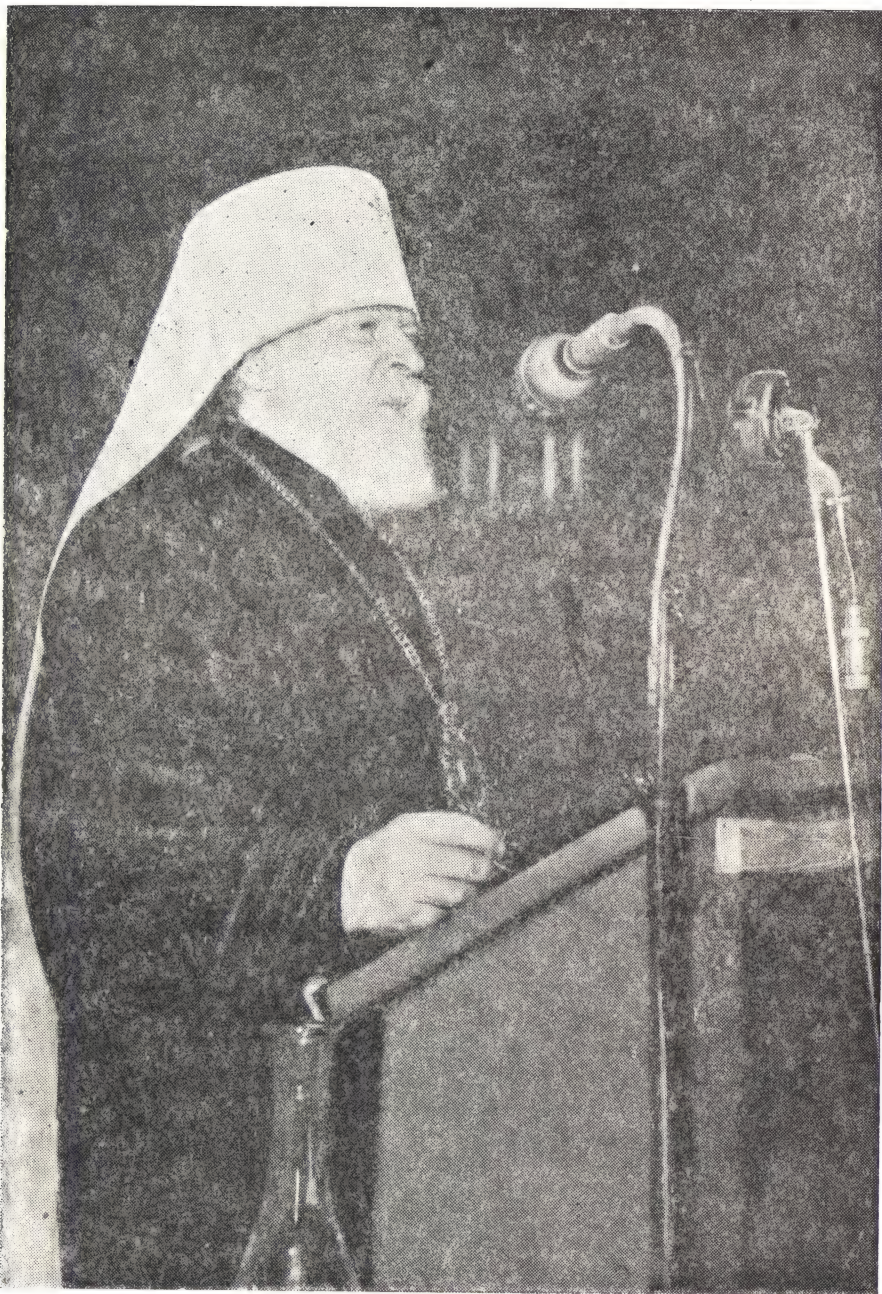
Митрополит Николай делает доклад на тему «Защита мира» в театре Ковинцы